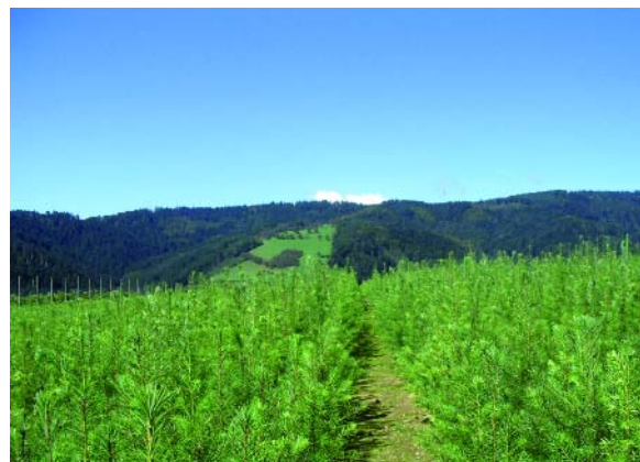
Abbildung 1: Douglasienanzucht in der Baumschule

Seit einigen Jahren ist die Nachfrage nach Douglasienpflanzen wieder deutlich gestiegen. Diese Tendenz wird sich in den nächsten Jahren verstärken. Denn neben ihren bekannten positiven Eigenschaften wie hohe Wüchsigkeit, mäßige Ansprüche an den Standort sowie eine relativ geringe Anfälligkeit gegenüber Schädlingen erhöhen insbesondere Borkenkäferkalamitäten bei der Fichte, eine mögliche Klimaerwärmung sowie gute Holzerlöse ihre Attraktivität für den forstlichen Anbau. In ihrer circa 125-jährigen Anbaugeschichte gab es auch Rückschläge, die jedoch meist auf falscher Herkunfts- oder Standortwahl beruhten. Die heute meist verwendeten „Grünen“ ( Viridis )-Douglasienherkünfte gelten als wüchsig und stabil. Dabei darf nicht übersehen werden, dass die „junge“ Douglasie eine der empfindlichsten Baumarten ist und ihre Nachzucht sowie ihr Anbau großer Sorgfalt bedarf, um das Ausfallrisiko zu begrenzen.