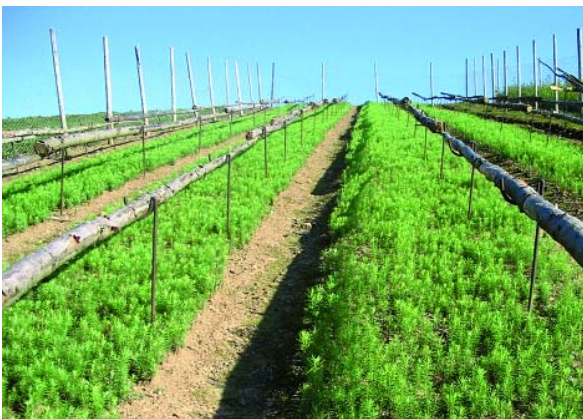
Abbildung 2: Baumschulbeete mit Douglasien und Frostschutzvorrichtung