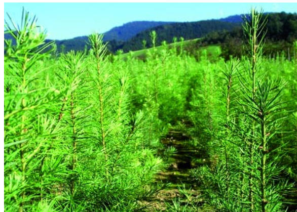
Abbildung 3: Stufige Douglasienpflanzen durch weite Reihenabstände