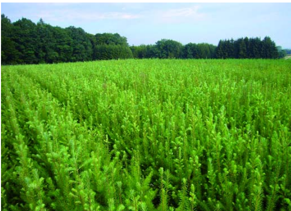
Abbildung 5: Blick über eine Douglasienanzuchtfläche

Die Douglasie ist empfindlich gegen verdämmenden Bodenbewuchs (Wasserkonkurrenz, erhöhte Frostgefahr). Deshalb kann es in den ersten zwei bis drei Jahren nach der Pflanzung notwendig sein, die Konkurrenzvegetation zu reduzieren. Dabei sollte aber nicht zu früh und nicht zu rigoros vorgegangen werden, weil die Begleitvegetation einen leichten Seitenschutz gegen Frostrocknis bietet.